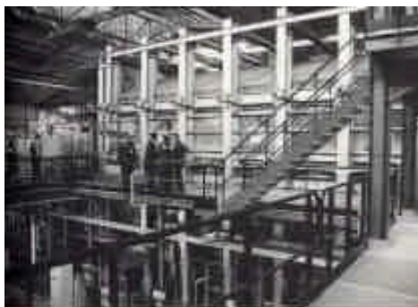
Vue générale du four