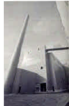
Une architecture audacieuse et fonctionnelle

Le four, d'une capacité de fusion de 500 tonnes par jour, alimente trois lignes de production combinant les procédés pressé-soufflé et soufflé-soufflé. Deux lignes sont dédiées aux modèles standards (moyennes et grandes séries) et une ligne aux modèles plus spécifiques (séries limitées). Équipées de machines "tandem", les trois lignes, une fois opérationnelles, fabriqueront jusqu'à cinq modèles différents. Ainsi, en réponse aux besoins des clients, l'usine pourra produire une gamme diversifiée allant des modèles «entrée de gamme» à 300 g (Optima) jusqu'aux modèles plus nobles et plus lourds (Sommelière).