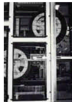
« Retourneur » de bouteilles

Pour garantir une assurance qualité consommateur accrue, le bout froid est séparé du bout chaud par une cloison. Après les machines de contrôle, le convoyeur est équipé de "retourneur de bouteilles" pour éliminer tout risque de corps étrangers dans les articles, le reste de ligne jusqu'au palettiseur est couvert. L'aire de stockage peut recevoir plus de 50 000 palettes.