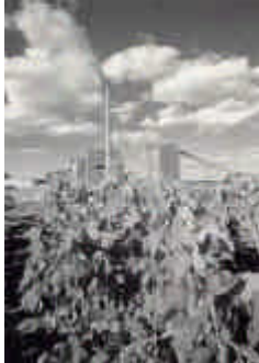
Au cœur des vignes, la nouvelle usine de BSN à Béziers

Le 5 août 1999, les verreries du groupe Danone, (BSN et VMC en France, BSN Vidrio en Espagne et Vereenigde Glasfabrieken en Hollande) fusionnaient avec six usines du groupe Gerresheimer en Allemagne pour donner naissance à un nouveau leader européen du verre d'emballage appelé BSN Glasspack depuis février 2000. A l'occasion de ce rapprochement CVC Capital Partners a acquis une participation de 56 % du capital, Danone en conservant 44 %. Avec 21 usines (qui disposent de 45 fours et de 146 lignes de production), neuf centres de valorisation et 8200 salariés, BSN Glasspack a une capacité de production annuelle d'emballage verre de 11 milliards d'unités (pots et bouteilles). La société se situe au 2ème rang européen de l'emballage en verre alimentaire avec un chiffre d'affaires de 1300 000 000 Euros. Le groupe représente 23 % du marché européen.